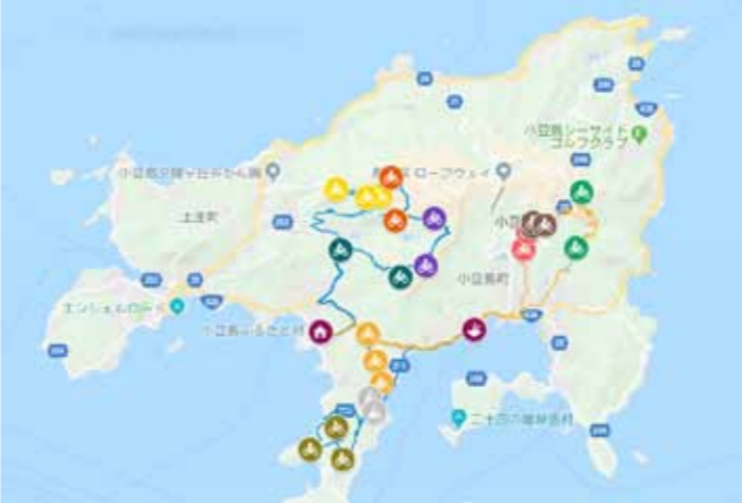
▲準備の際に走行したGPSログ。本番とほぼ同じコースだが要した時間は2倍以上。安全に走ってもらうためにしっかり。 ▼忘れてはいけないのが許可申請。ここからすべてがはじまる。今年も安全運転を条件に許可していただきました。