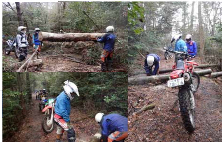
▲背中にチェーンソーを背負って移動。倒木を切って切って切りまくる。