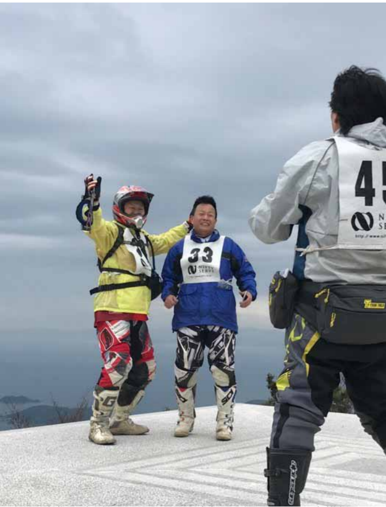
▲四方指、定番スポットでの写真撮影どんよりした空模様での素晴らしい景色なのです。 ▶中間チェックポイントにて。楽しんでるよ！という気持ちが顔にしっかりと出ています。

すべての準備が完了し、毎年のように皆さんの笑顔をお迎えすることができました。この笑顔のためにスタッフは奮闘してくれています。暑からず寒からず。そして花の季節。今回はそんな時期を狙って日程を決めました。桜の開花が始まったタイミングで寒の戻りがあり、少し足踏みしてくれたおかげで桜吹雪の小豆島を走ることが出来ました。過去25回の中で初めてのことじゃないのかな？ 事前準備でしっかりとコースを整え、桜満開の小豆島で今年ものライダーのみなさんをいつものようにお迎えすることができました。 1月から募集を開始して、3月には早々に満員御礼となりました。西は九州、東は遠く岩手から総勢123名がふるさと村に集まってきました。前回の秋開催から春開催に変わりました。季節が変わればこれまで変わるのか、と思わせの彩りを見せてくれた小豆島。今回もきつと楽しみに違いません。 そういえばここ数年、何かが変わってきたのを感じていました。大きな音のバイクがなくなり、交通ルールをしっかりと守って走っていただいている。なによりもにやかに楽しく走っていただいている。そして昨年からは始めたスタート前のフリーフィンゲでは拡声器を使わなくても聞こえるように、と静かに聞いていただいている。この小豆島をずっとこれからも走りたいたいと言っみなさんのお気持ちなのでしょうか、どれだけこのイベントを楽しみにしていただけているのか、しっかりと伝わってきました。